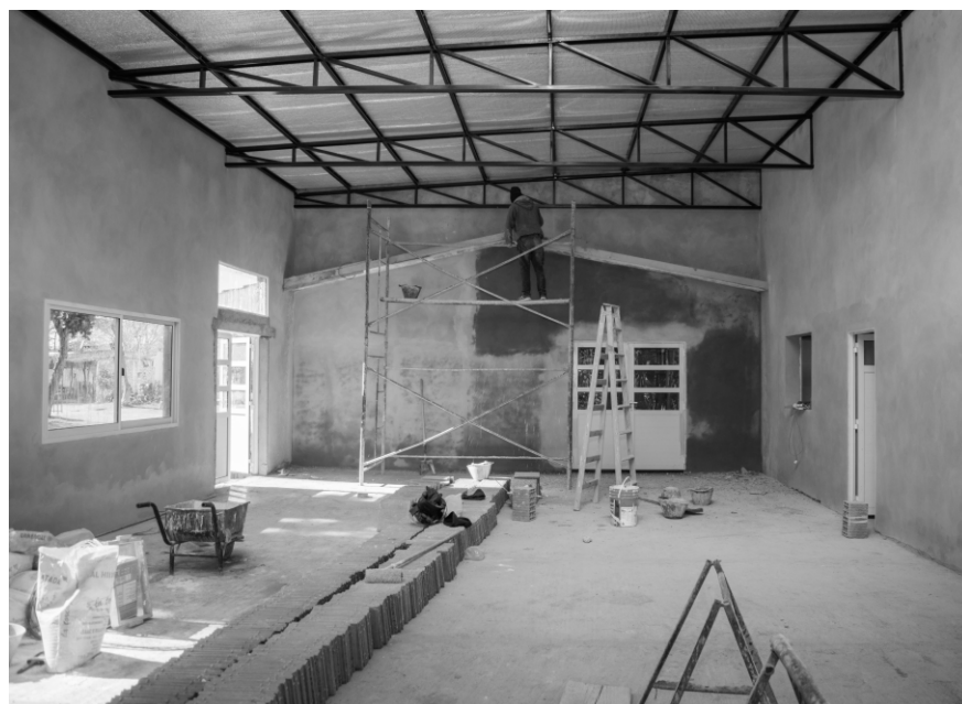
El TUM de la Escuela Antártida Argentina de Villa Taminga en su última etapa

En el caso de la Escuela primaria "General José de San Martín" de Salsacate, se construyeron aulas con formato TUM - Taller de Usos Múltiples -, se está realizando una nueva aula para el jardín y ya se entregaron más de 100 sillas. Durante los festejos por el Día de los Jardines de Infante, también se hizo entrega de una impresora láser y juguetes para las salas de 3 y 4 años. Lo mismo sucede en la Escuela "Antártida Argentina" de Villa