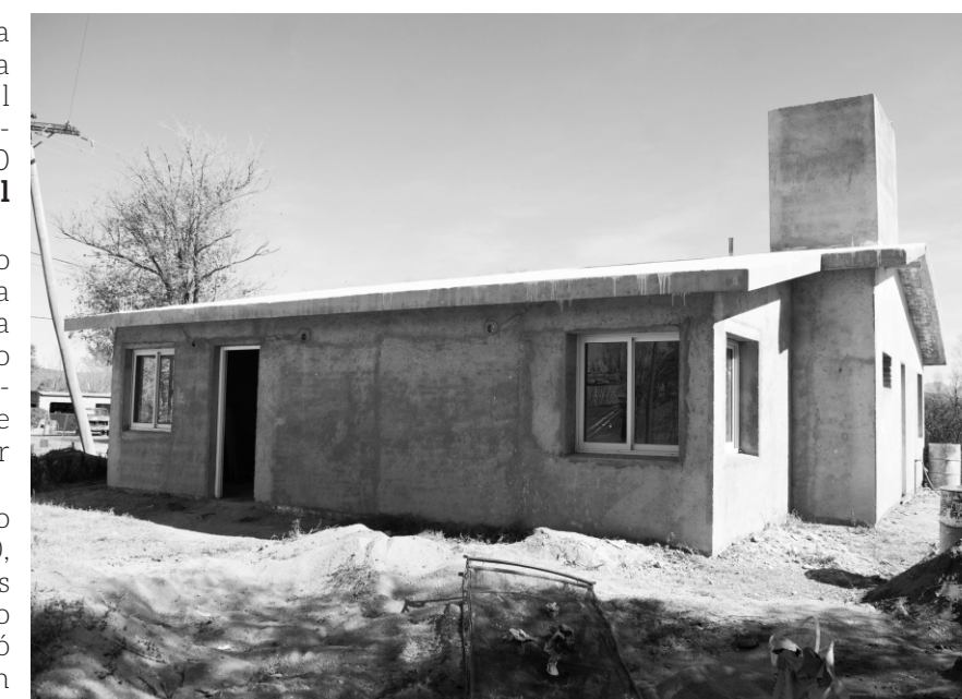
La futura Casa del Médico en su última etapa de construcción

que se realiza con fondos económicos genuinos de la propia Municipalidad y del Fondo Federal Solidario, cuenta con una mayor cantidad de salas y espacios respecto al antiguo proyecto, encontrándose en un grado de avance superior al 80%. En el establecimiento se incorporarán especialidades médicas como ser odontología,