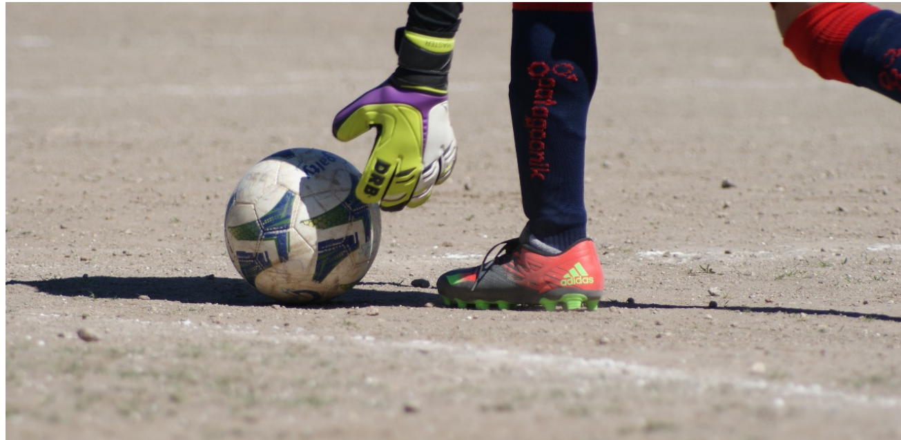
Los clubes de Salsacate aún buscan su rumbo

El equipo que comenzó con algunos nombres nuevos y que prometían aportar desequilibrio y goles, fue mutando hasta llegar a éstas últimas formaciones que terminaron con apellidos llamados de